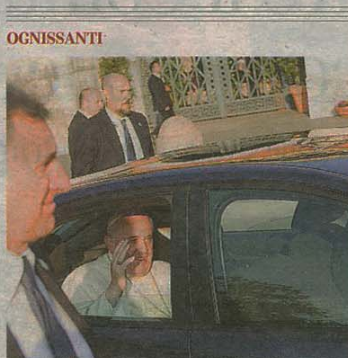
OGNISSANTI Acclamato Papa Francesco all'arrivo al Verano (foto Jpeg)

Il Papa al Verano «Ora devastazioni più che nel '43»